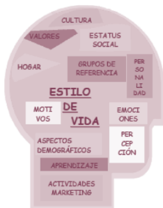
Figura 2. Estilos de vida. Fuente: Meneses P, 2011. Los 6 estilos de vida y sus principales características. Disponible en: tecnologia1leonauderld.blogspot.com .

Estilo de vida (figura 2): hábitos dietéticos, ejercicio físico, consumo de drogas, afrontamiento de situaciones psíquicas (conductas sexuales, violencia, duelos, situación de estrés, etc.). Utilización de los servicios médicos, sociales, educativos, etc.