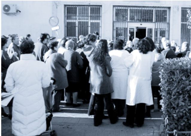
↑ Centro de Salud Vicente Soldevilla de Madrid.