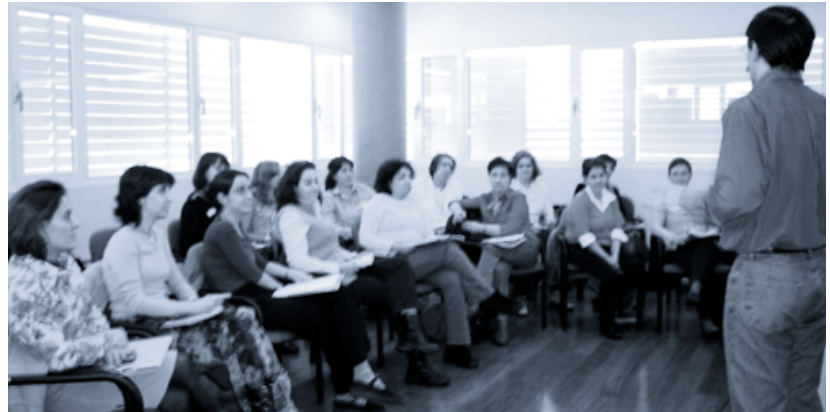
↑ Formación a profesionales.

Se ha pensado iniciar una formación más avanzada en este año 2004 con un curso de 30 horas, dirigido a los profesionales de los centros de salud, con el objetivo de abordar contenidos psicosociales en EpS y de capacitar a estos profesionales para trabajar también con la guía.