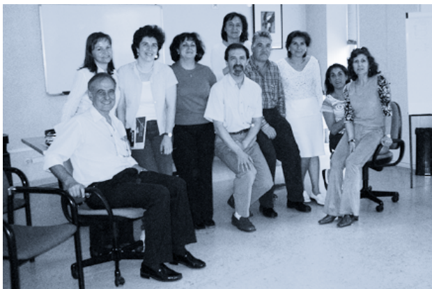
↑ Grupo de formadores en educación para la salud.

En total, el número de asistentes ha sido de 352 personas (282 mujeres [80%] y 70 hombres [20%]). El intervalo de edad de la población asistente oscila entre 22 y 70 años, siendo la población adulta madura el grupo mayoritario.