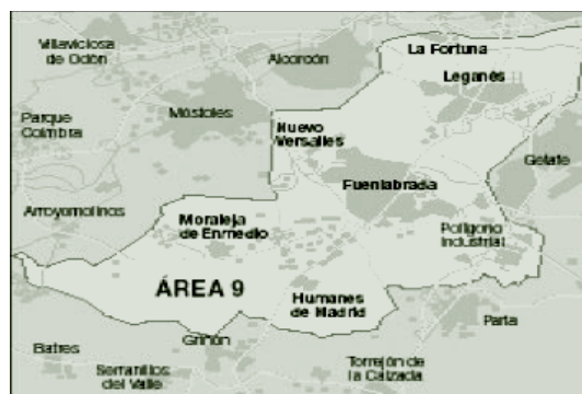
↑ Municipios del Área Sanitaria 9.

En la tabla I se exponen algunos indicadores demográficos de las zonas básicas implicadas. Cabe destacar que la mayoría de las zonas básicas de Leganés tienen una población más envejecida que las de Fuenlabrada.