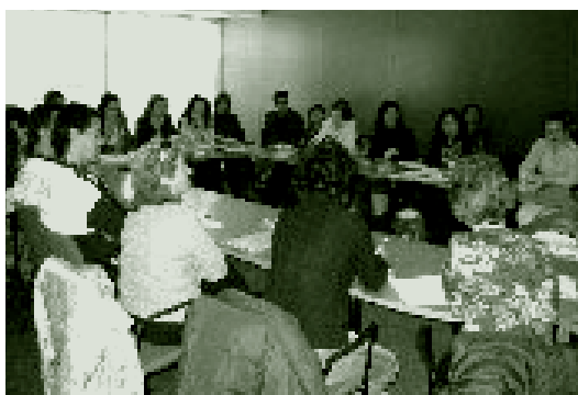
↑ Comité Técnico de Fuenlabrada.

utilizadas por la población como guía de recursos, y 3) presentación en cada comité de los diferentes recursos según un guión previo consensuado. Hay que señalar que de esta coordinación se han producido sinergias espontáneas de colaboración en temas puntuales y específicos que están dando ya sus frutos.