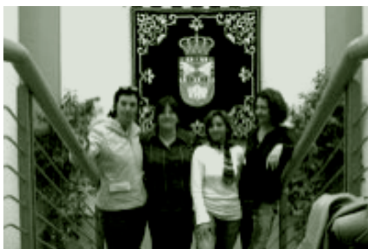
↑ Núcleo de M. Curie.

Paralelamente, la gerencia del área invitó a participar a todos los recursos técnicos de los cuatro territorios a un espacio de encuentro con el asesor para clarificar los aspectos metodológicos y técnicos del proceso. A esta sesión, presidida por la gerencia y realizada en un centro de salud, acudieron más de 70 recursos y posibilitó que se produjesen encuentros informales entre el personal técnico de los territorios.