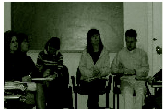
↑ Comité Técnico Asesor de M. Carriche.