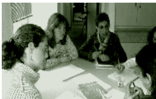
↑ Responsables de procesos.

Así, durante 2004, se realizaron en cada centro varias sesiones para devolver la formación recibida, debatir y reflexionar sobre el tema, valorar si el equipo apoyaba el inicio de un proceso comunitario y establecer un responsable del proceso, dejando claro que su implicación en el mismo era parte del trabajo del equipo y, por lo tanto, debería ser asumido por éste.