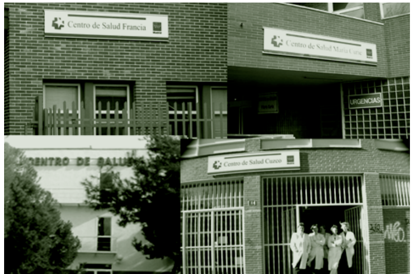
↑ Centros de salud.

Durante muchos años, en el Área 9 de Madrid nos hemos planteado si era posible impulsar la participación comunitaria desde los centros de salud en el contexto social en el que vivimos y, a pesar de ser un área con una larga trayectoria comunitaria, sólo desde hace relativamente poco tiempo hemos iniciado procesos comunitarios tendentes a trabajar con la comunidad y no sólo para la comunidad.