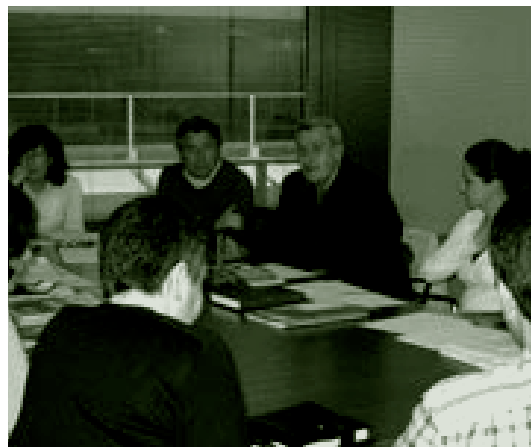
↑ Comité Técnico de Leganés.

Hay que señalar que la credibilidad de los profesionales sanitarios que se implicaban fue uno de los elementos clave en estos momentos iniciales.