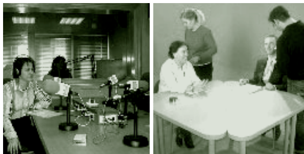
↑ Trabajo en medios de comunicación.